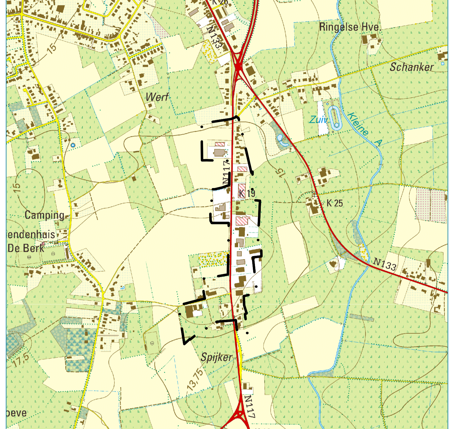
Situering op topografische kaart (1/10 000)